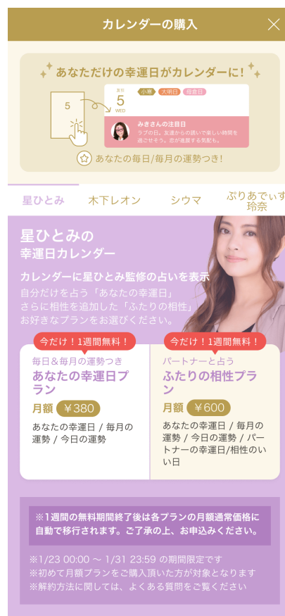
月額プラン購入ページ

※ご購入から一週間の無料期間が終了後は、各プランの月額通常価格に自動で移行されます。ご了承の上、お申込みください。